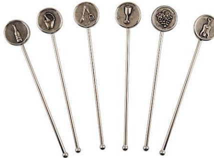
REMOVEDORES Figuritas, dorados Pack 100 ud.