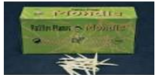
PALILLO REDONDO ENFUNDADO V-1000