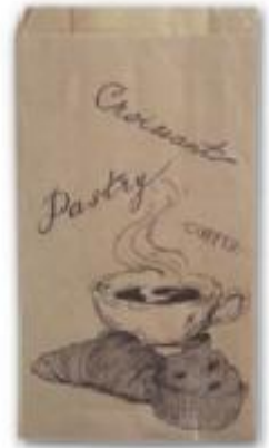
BOLSA PAPEL Bollería kraft 14+2x7+26 cm Caja . 1000 ud. BOPABO0002