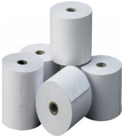
ROLLO PAPEL TERMICO 80X80 -P6- RT80*80 80X55 - P6- RT80*55 60*55- P6 - RT60*555