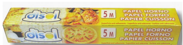
PAPEL DE HORNO. Rollo 5 metros