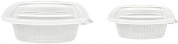
ENVASE PP (MICRONDABLE)

TAMAÑOS: 2000ml/ 1500ml/750ml/500ml/250ml Pack 100 ud