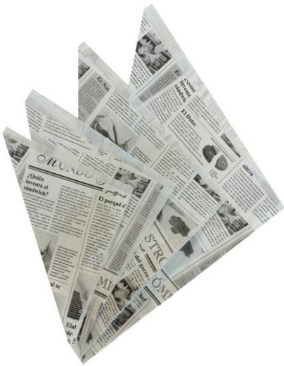
PAPELINA Punta ANTIGRASA Times 70 gr 28 x34 cm Pack . 250 ud. Caja 2000 ud RB