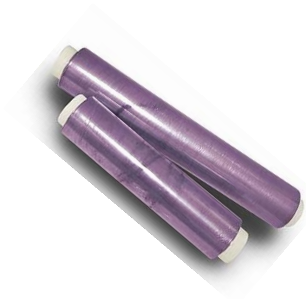
FILM INDUSTRIAL. 30 cm/ 45 cm