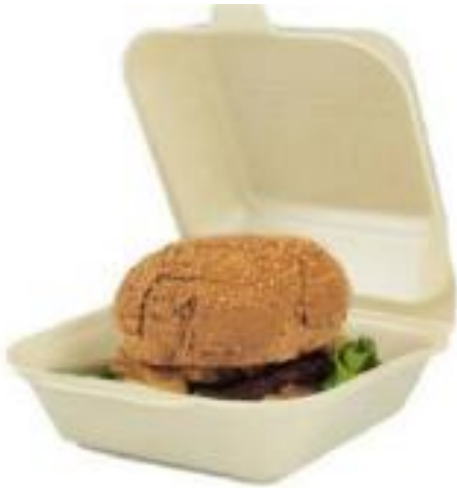
ENVASE HAMBURGUESA 150x150x70 mm MATERIAL: FOAM Caja: 4Pack x125 uds ERFO0002/