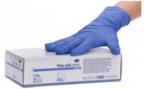
GUANTES DE NITRILO Azul