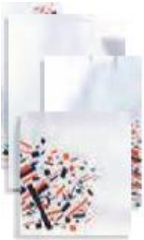
BOLSA ANTIGRASA 40 GR/ Anónima 15x28+6 mm Caja . 2000 ud. BOPAAN0001/BBA