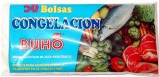
BOLSA CONGELACIÓN Tamaño 25X35 // 30Z40 Pack 50 uds.