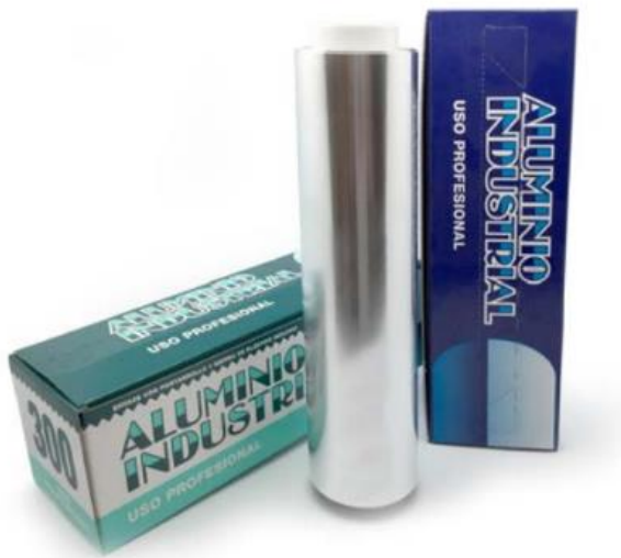
ALUMINIO INDUSTRIAL C/ CAJA DISPENSADORA 30 cm / 40 cm