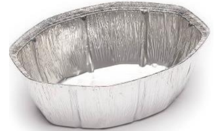
ENVASE ALUMINIO POLLO Capa 2500 ml 255X193x84 mm Con tapa carton. Caja: 3Pack x100 uds