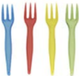
PINCHOS DE COLORES 885mm Caja 10x100 CUPSO0007