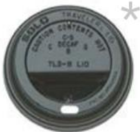
TAPA VASO NEGRA Caja 10x100 ud U.V 100 min. TAPAVA009 / TVPC