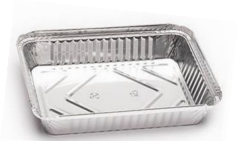
ENVASE ALUMINIO 1125 ml. 225x175x35 mm Con tapa carton. Caja: 12 Pack x100 uds