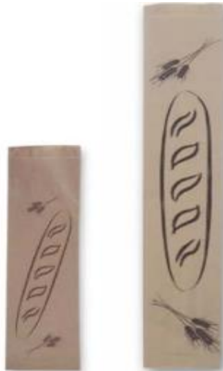
BOLSA PAPEL 1 Baguette kraft .- 9+(2x5)x55cm BOPAPA0003 2 Baguette Kraft.- 11+(2x7)x55 cm BOPAPA004 Caja . 1000 ud.