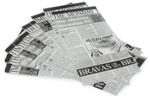
PAPEL para hamburguesa 28 x34 cm Caja .1000 ud.RB