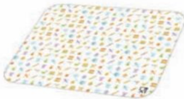
TAPA ENVASE DE ALUMINIO Tapa para env 600 ml: Caja 6x100 Tapa para env 1125ml Caja 12x100 Tapa para envase de 3200 ml: Caja 4x100