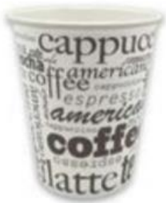
VASO CAFE CARTON 240 ml / Caja 50 x20 U.V. Mínimo 100 ud Caja . 1x1000. VAPACA00032 / VPC