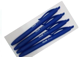
BOLIGRAFO Tinta liquida Azul/ Negro / Rojo Pack 4 uds- /BOLICOL