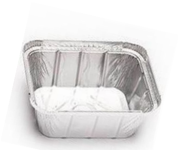
ENVASE ALUMINIO 470 ml. 145x120x40 mm Con tapa carton. Caja: 10 Pack x100 uds