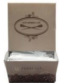
REMOVEDORES CAFE Tamaño 110 mm U.V. Mínimo 100 ud Caja dispensadora 2000 UD. CUPSTRO006