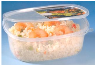
ENVASE MICRONDABLE RIGIDO.

TAMAÑOS: 1500ml/1000ml/750ml Pack 100 ud