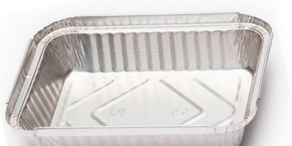
ENVASE ALUMINIO 3240 ml 319x262x50 mm Con tapa carton. Caja: 4 Pack x100 uds