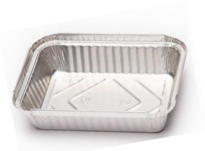
ENVASE ALUMINIO 600 ml. 192x140x40 mm Con tapa carton. Caja: 6 Pack x100 uds