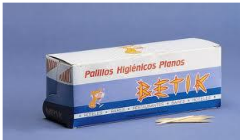
PALILLO PLANO V- 2.4 M