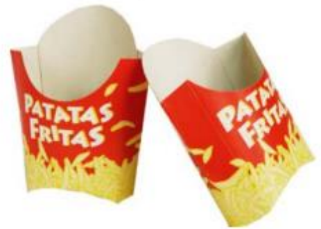
PETACA PATATA FRITA ECONOMICA 140x55x135 mm Caja: 1x1000 uds ERPAMU00016