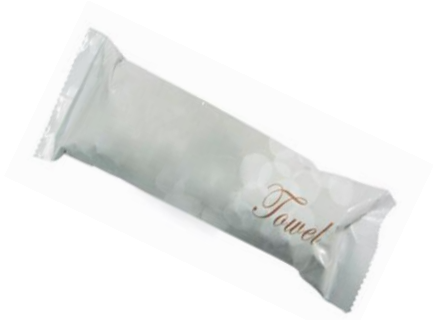
TOALLITA HUMEDA Walky Roll