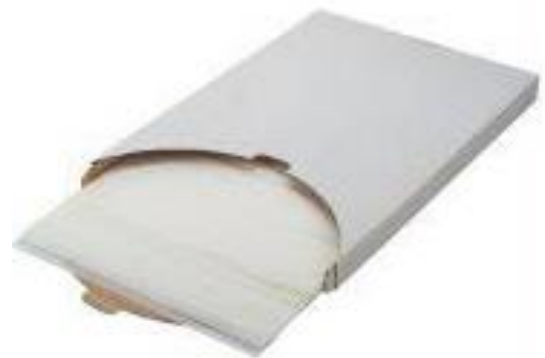
HOJA PAPEL DE HORNO Tamaño 40x60 Caja 500 uds. Cod. HPH .