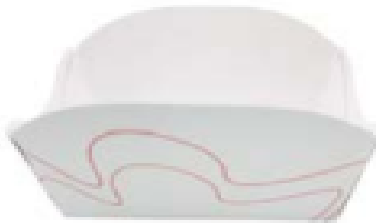
BARQUITA CARTON 116x75x43 mm Caja . 1x1000. ERPAMU00010